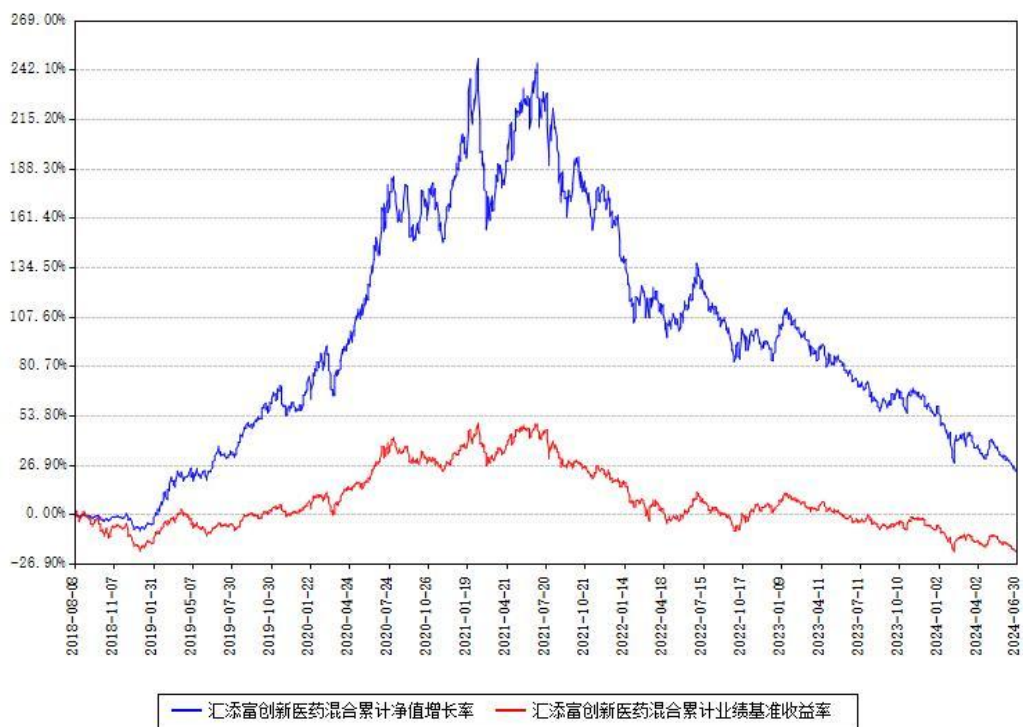
汇添富创新医药混合累计净值增长率与同期业绩基准收益率对比图