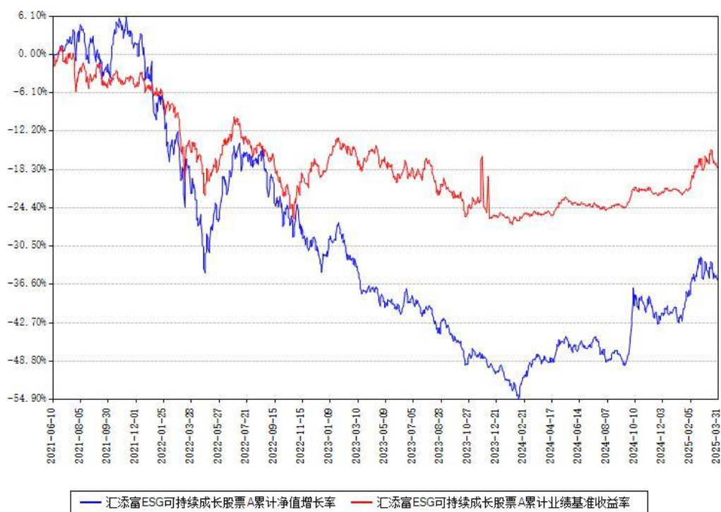
汇添富 ESG 可持续成长股票 A 累计净值增长率与同期业绩基准收益率对比图